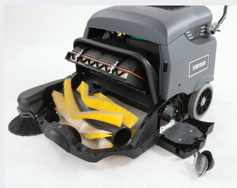
ブラシやフィルターなどのメンテナンス性に優れ、工具不要で交換が可能。