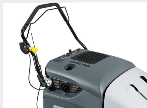
高さ調節可能で折り畳みもできるハンドルと、操作が容易な速度調節バーを装備