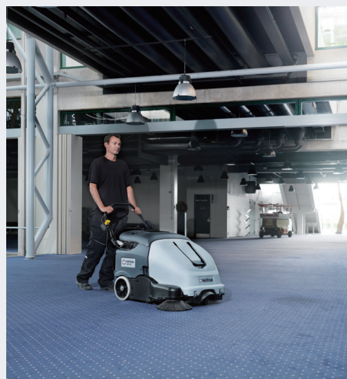
屋内・屋外両方で使用でき、カーペット清掃にも最適。オプションでノンマーキングスカートを装備できます。